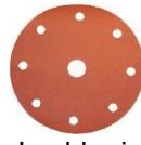
Lochkreis- Ø 65 mm FEIN-Lochung