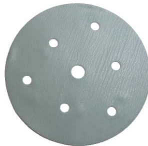
BUFLEX dry green + / - P 2000