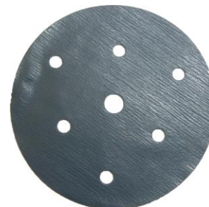
BUFLEX dry black + / - P 3000