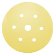
ASSILEX lemon + / - P 800