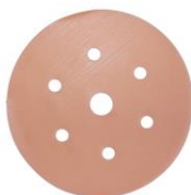
ASSILEX orange + / - P 1.200