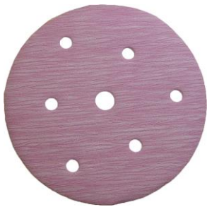
TOLEX pink + / - P 1500

Egal, ob Sie Fehlstellen in Lackoberflächen zu beseitigen haben, ob Sie Oberflächen vor der Endlackierung anschleifen wollen, oder ob Sie Polierzeiten deutlich reduzieren wollen, mit TOLEX und BUFLEX dry haben Sie ein Schleifsystem, das vollkommen neue Maßstäbe setzt. Verwenden Sie die passenden Zwischenteller für ein optimales Schleifergebnis! KX-971-0044 für TOLEX und KX-971-0067 für BUFLEX dry.